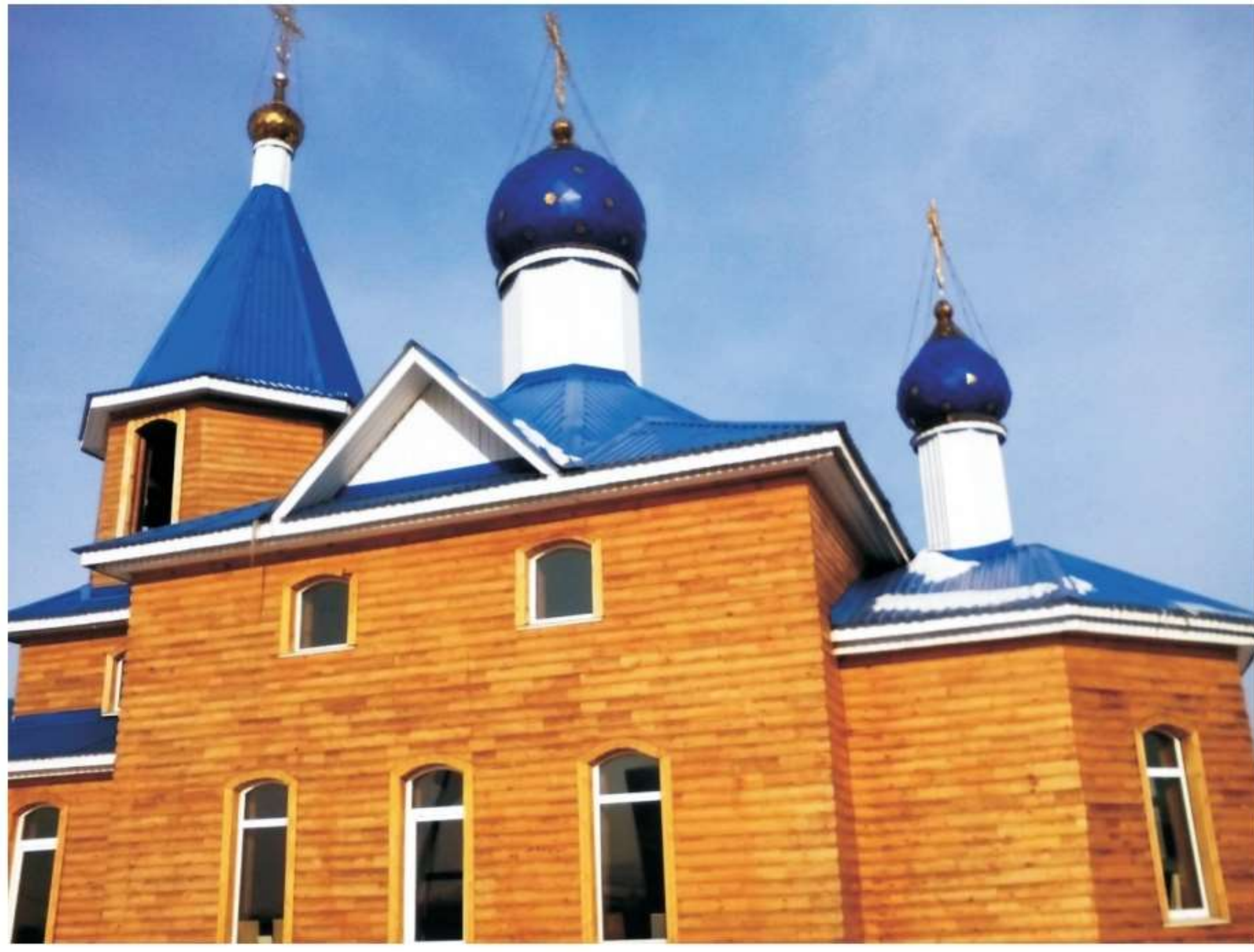
Храм «Рождества Христово»